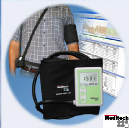
ABPM-05 verenpaineen pitkäaika isrekisteröintiin