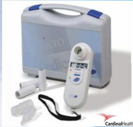
MicroCO hiilimonoksidipitoisuuden mittaamiseen